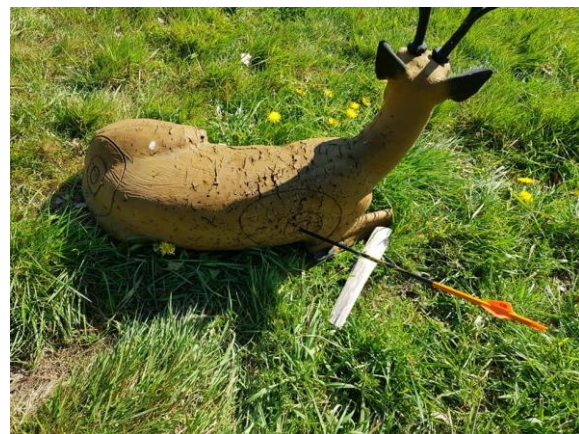
Das Ziel im „Innen Kill) getroffen

Zu Pfingsten möchte es sich eine kleine - oder größere - Schar von Schützen in Venne gut gehen lassen. Mittlerweile sind es ca. 25 "Kollegen" aus vier Vereinen, es wird ein schönes, verbindendes Treffen werden. Am Samstag den 08.06. geht es im Parcours gegen 09:00 Uhr los. Wir teilen die „Mannschaft“ nach Erfahrung und Schießtechnik in verschiedene Gruppen, um den Parcours zu begehen. So kann jeder nach seinen Fähigkeiten schießen, und die Rotten werden nicht zu groß. Erfahrene Schützen/innen können natürlich "auf eigene Faust" los. Am Abend werden wir uns dann alle gemeinsam im Volltreffer „begrillen“ lassen. Wahlweise in lauer Sommerluft auf der Terrasse, oder in der Gaststube. Am Sonntag ist die Abreise, eventuell nach einem weiteren Durchgang im Parcours.