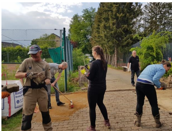
Die Kette des Erfolgs ...

z.B. das „Abrütteln“ der Fläche mit Maschineneinsatz auch auf dem Montag gelegt, um die Nachbarschaft am Wochenende nicht zu stören. Es war schon sehr beeindruckend zu sehen, dass so viele Mitglieder – aus den Sparten Bogensport und Hockey - dem Ruf gefolgt sind, ihr Training aufgegeben haben um zum Gelingen dieser – durchaus nicht einfachen - Aktion beigetragen haben. Als nächsten Schritt werden wir die Beleuchtung im Bereich des Parkplatzes und der Zuwegung austauschen, die nach den Jahren nun deutlich Spuren der Zeit aufweist. Bei dieser Gelegenheit werden alle Leitungen erneuert, die vom Clubhaus bis auf den Parkplatz führen. Damit verbunden werden Möglichkeiten der Stromabnahme auf der Arena geschaffen, was uns für kommende Arbeitsdienste das Leben deutlich erleichtern wird. Wir bedanken uns bei allen Heferinnen und Helfern für diese großartige Aktion und freuen uns sehr, das wir in diesem, unseren Verein einmal mehr den Beweis angetreten haben: Nicht ist (uns) unmöglich ... !