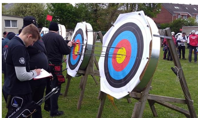
Trefferaufnahme, die 122 Auflage bietet ein gutes Ziel

Wir wollten im (vor)letzten Jahr einen Klassiker aus der Taufe heben - und dieses ist uns gelungen. Mit der legendären "Wasserschlacht mit Orkanböen" Anno 2018 haben wir - und die Elemente - eine Legende geschaffen. Auch an diesem 1. Mai wurde das Turnier von der Bogensportsparte des IHC ausgerichtet, und natürlich wieder als eine 900er Runde, unter einem zusätzlichen Motto. diesem Jahr haben wir den optimistischen Titel: „Gold und Sonne“ gewählt.