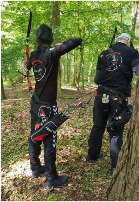
Und wieder eine sehr gute Haltungsnote

Auch in diesem Jahr haben unsere Schützen/innen sehr erfolgreich an der Kreismeisterschaft Feldbogen teilgenommen“. In dieser Bogendisziplin wird im Wald auf Scheiben geschossen. Bei einer Runde sind die Entfernungen bekannt, bei einer Weiteren nicht. Vier Landesmeister und ein Vize sind eindeutig ein fantastisches Ergebnis, da somit jeder unserer Starter/innen eine Medaille „mit nach Hause gebracht hat.