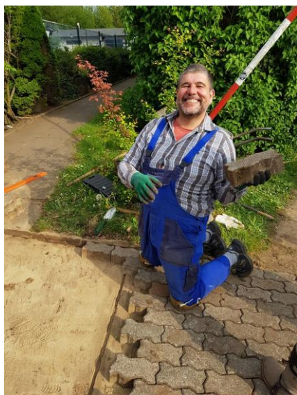
Mit Spaß an der Arbeit. Eine Arie „in Stein“

Lange haben die Vorbereitungen gedauert, aber nun werden die Planungen in die Tat umgesetzt. Die Stolperfallen, die unsere Auffahrt seit einigen Jahren verunzierten, sind Vergangenheit. Schon im letzten Jahr haben wir mit einem Arbeitsdienst das Grundübel dafür