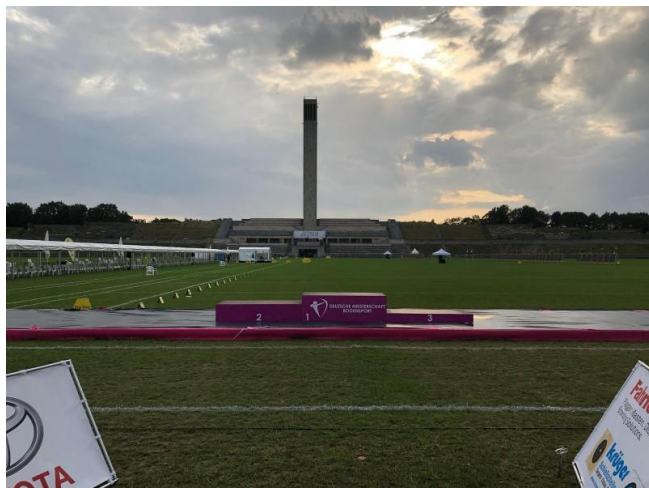
Ein imposanter Austragungsort

Die letzte Pässe, der erste Schuss ins Gold ,top es läuft , den zweiten und dritten Pfeil habe ich leider beide verrissen, ein Blick durch das Fernglas und... oh nein, der eine mit Glück noch eine 5 und der Andere sogar nur im weißen, also noch mal tief durchatmen. Die letzten 3 Pfeile verschoss ich ohne noch mal nach zu schauen, es sollten aber alle gut gewesen sein. Als ich zur Punkteaufnahme nach vorne kam, sah ich folgendes, je ein Pfeil in (X,9,9,8,5,1) eine 42. Ich war mit dem Endergebnis zufrieden 541 Ringe standen jetzt auf meinem Konto und den 14 Platz habe ich damit auch halten können. Dennis und