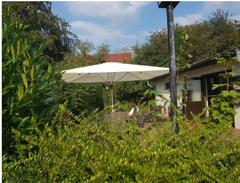
Der neue Schirm verbreitet mediterranen Charme

Seit Jahren wird im Vorstand diskutiert unserer Terrasse am Clubhaus so auszustatten das diese für unsere Mitglieder ansprechend zum dortigen Verweilen ist. Im letzten Jahr wurden neue Terrassenmöbel angeschafft. Das noch eine Beschattung fehlt darüber war man sich im Vorstand einig. Ob Pavillon, Schirm oder Sonnensegel, darüber wurde wiederum lang diskutiert. Nun ist die Entscheidung zu Gunsten eines großen, hellen Sonnenschirms gefallen. Das neue Prunkstück, auf unserer Terrasse, misst 4x4