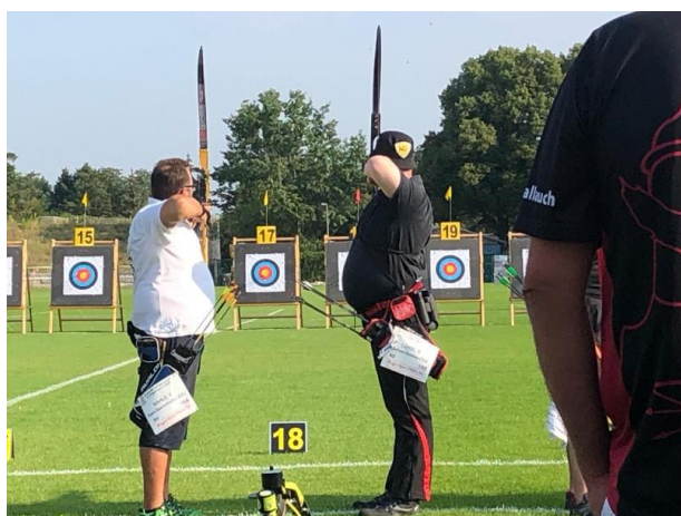
In Aktion ...