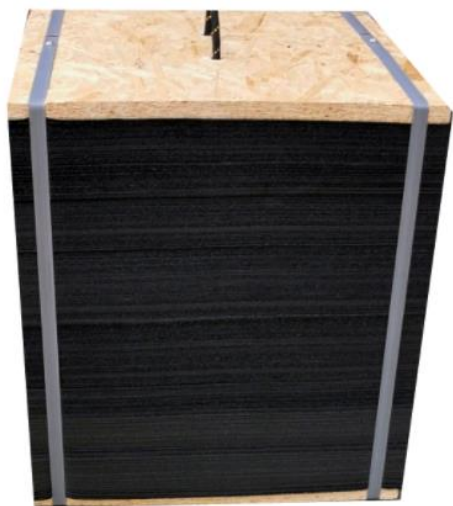
Der Würfel von ARCHERYDIRECT

der Lock down will offenbar kein Ende nehmen, du die Entzugserscheinungen nehmen zu. Die Pfeile möchten fliegen, weit und gern auch wieder einmal im Wald. Aber, derzeit ist dieses leider nicht möglich. Um hier nun nicht völlig aus dem Training zu geraten, hat sich sicher jede/r von uns – nach den bestehenden Umständen – eine provisorische Möglichkeit geschaffen, zumindest auf Kurzdistanzen, das Training aufrecht zu erhalten.