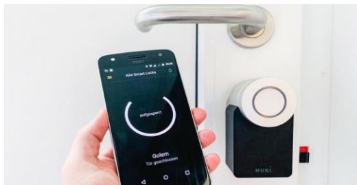
Beispielfoto von der Website https://nuki.io/de/