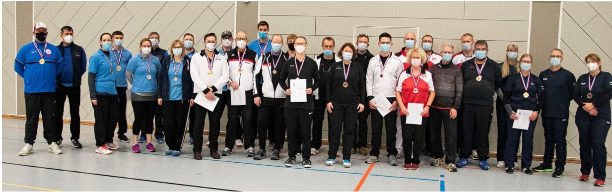
Zufriedene Teilnehmer/innen nach einem gelungenen Turnier

Insg. 49 Bogenschützinnen und -Schützen im Alter von 7 Jahren bis 78 Jahren aus den fünf Vereinen 1. Kellinghusener Bogenclub, Itzehoer Hockey-Club, Bogensportverein Glückstadt, TSV Kremperheide und SV Merkur Kleve stellten sich den Wettkämpfen. Es wurden insg. 60 Pfeile in einer Entfernung von 10m (Klasse Schüler C) bzw. 18m (alle anderen Klassen) geschossen. Das Teilnehmerfeld ist weit gefächert: Der jüngste Teilnehmer war 7 Jahre alt und der älteste 78 Jahre. Es traten an 31 Bogenschützinnen und -schützen mit dem olympischen Recurve, 14 Schützinnen und Schützen mit einem Blankbogen und 4 Schützinnen und Schützen mit einem Compoundbogen