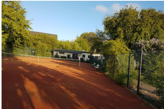
Ein schönes Fleckchen Erde

So langsam kann man die Wochen zählen, bis auf unserer Anlage wieder Tennis gespielt werden kann. Nachdem im vergangenen Jahr der untere Platz mit neuen Linien ausgestattet wurde, folgt nun, vor Beginn dieser Saison, der obere Platz. Wenn dann mit Hilfe hoffentlich vieler Mitglieder die Plätze für den Spielbetrieb hergerichtet werden,