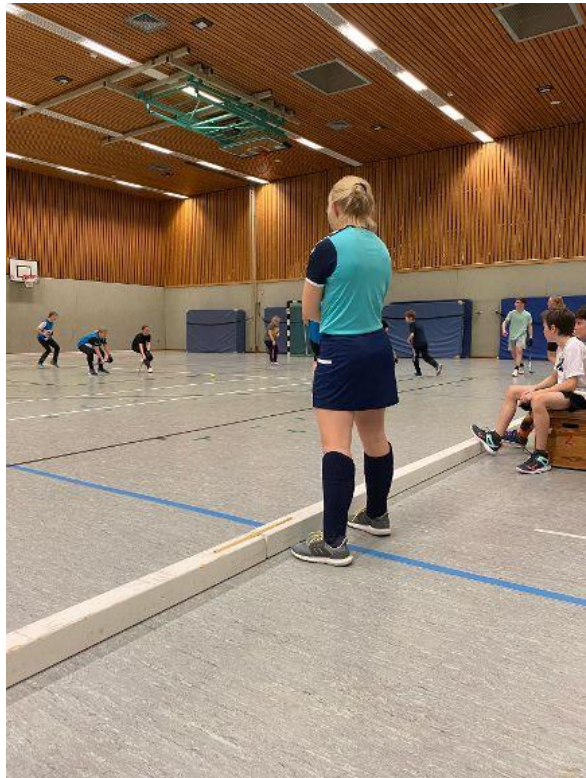
Sport mit Spaß

Als erstes, wenn wir ankommen, werden immer die Banden aufgebaut. Als Nächstes spielen wir dann meistens mit den Kleinen Tick. Nachdem wir fertig gespielt haben, laufen wir uns noch drei Runden ein, damit wir auch richtig warm sind.