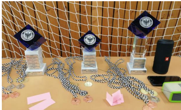
Die begehrten Pokale

Es war mal wieder so weit, am 19.03. wurde der VII. Hallen-Cup ausgeschossen. Aufgrund unser vielen Schützinnen war das diesjährige Motto „Damenwahl“. Unsere Damen durften sich ihre Schützenpartner also aus einem Lostopf ziehen und dann ihre