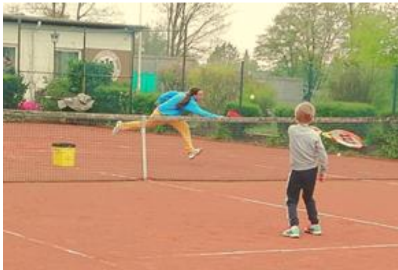
Manchmal muss der Trainer ganz schön laufen.

Es hat ihnen soviel Spaß gemacht, dass sie donnerstags eine Trainingsgruppe gebildet haben. Für den Dienstagstermin hat sich ebenfalls eine Gruppe gebildet, die aus erwachsenen Anfängern und Fortgeschrittenen besteht. Auch hier sind im Moment alle Plätze belegt. Die gute Nachricht für alle, die Interesse am Training haben und ein wenig flexibel sind: