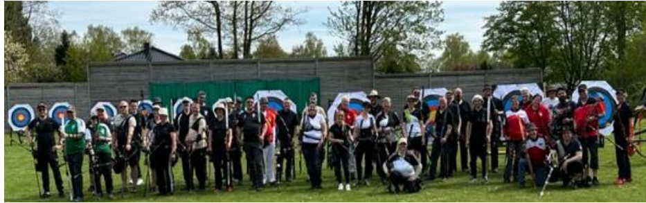
Das Teilnehmerfeld zur 900er Runde am ersten Mai

Auch wenn wir schon lange keinen Kaiser mehr haben (selbst zur Vereinsgründung vor 99 Jahren), so ist sein Wetter doch geblieben.