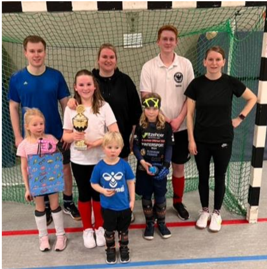
Stolz wir der Pokal von den „Schnarchnasen“ präsentiert

den begehrten Tüddelturnier Wanderpokal. Die Zuschauer konnten sich über viele spannende Spiele freuen, in denen jeder sein Bestes gegeben hat. Wie immer war es schön zu sehen, wie rücksichtsvoll alle miteinander umgehen. Jeder noch so kleinen Spieler bekam die Chance, sein Können unter Beweis zu stellen. Am Ende setzten sich die