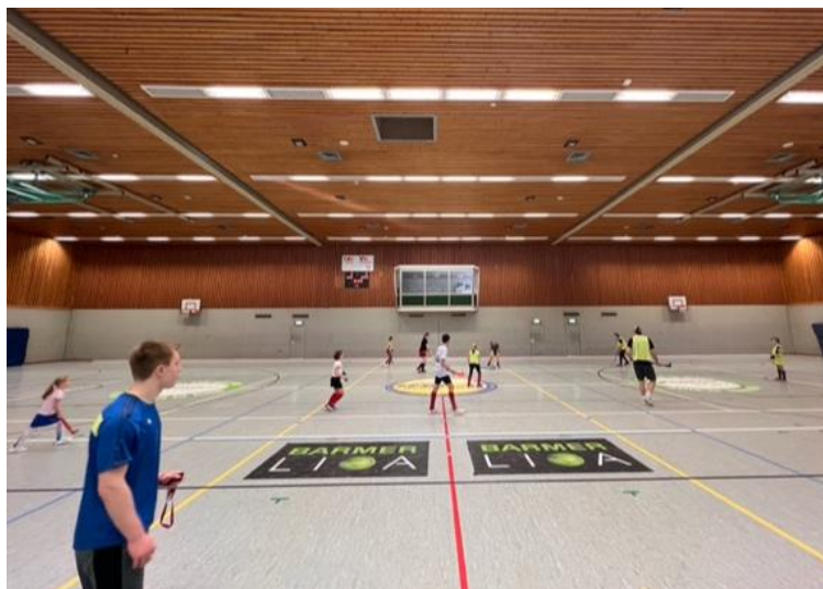
Leben in der Halle

Schon am Vorabend wurde sich in der Halle auf das Turnier vorbereitet. Es fand ein nettes Zusammentreffen der Herren und Damen statt, die sich jedes Jahr auf den Weg zum Turnier nach Moormerland machen. Mit großer Beteiligung wurde erst gespielt und