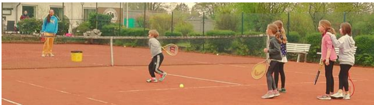
Erste Trainingssession für Kidz seit dem Platzaufbau. Hier eine Einzelübung.

Das Schnuppercamp für Kidz am 23.04. war ein voller Erfolg. Fünf Kidz sind am Sonntag früh aufgestanden und zum Laufen, Gymnastik machen, Theorietraining und für Wettkampfübungen angetreten. Die Kälte hat ihnen nichts ausgemacht, sie waren motiviert und wissbegierig und haben bewiesen, dass 90 Minuten eine angemessene Trainingslänge sind.